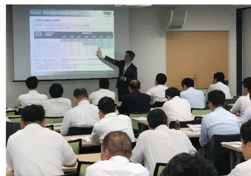
解説に耳を傾ける参加者の皆様

参加いただいたお取引様からは、「具体的でわかりやすいセミナーであったため、自社で検討を進める際に有益となる情報・アドバイスを得られた。」という声が聞かれました。